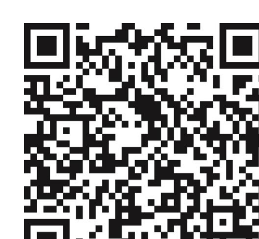
Weitere Informationen BZgA

Otras indicaciones: * www.rki.de/covid-19-europa ** www.bundesregierung.de/breg-de/themen/coronavirus/corona-bundeslaender-1745198