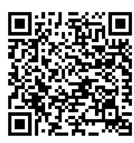
**Corona-Regelungen in den Bundesländern