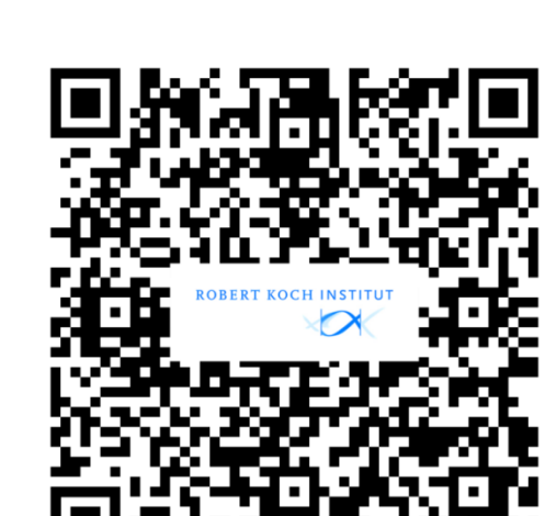
Weitere Informationen RKI