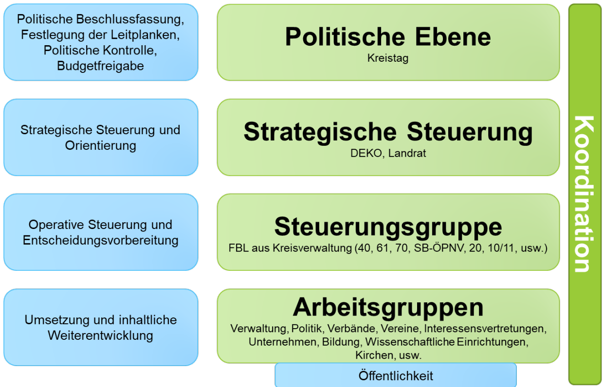
Abbildung 1: Geplante Steuerungsstruktur für das Nachhaltigkeitsmanagement des Landkreises