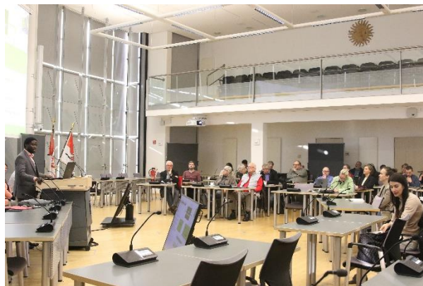
Abbildung 2: Abschlussveranstaltung am 20.01.2026

Während der Abschlussveranstaltung mit Vertretern aus Verwaltung, Politik und Zivilgesellschaft wurde ein Überblick über das Konzept, den Managementprozess und die Umsetzungsstrategie gegeben. Darüber hinaus wurde ein Überblick über das Folgeprojekt mit seinen verschiedenen Arbeitspaketen und Aktivitäten vorgestellt. Der Titel lautet „Anschlussvorhaben zur Umsetzung des Nachhaltigkeitskonzepts des Landkreises Spree-Neiße/Wokrejs Sprjewja-Nysa (AZUN)“ mit einer Projektlaufzeit vom 01.02.2026 bis zum 31.01.2029. Es handelt sich um ein Folgeprojekt, das ebenfalls vom Bundesministerium für Umwelt, Klimaschutz, Naturschutz und nukleare Sicherheit (BMUKN) gefördert wird. Weitere Informationen und Aktualisierungen zum Projekt werden in Kürze auf der Website des Landkreises veröffentlicht.