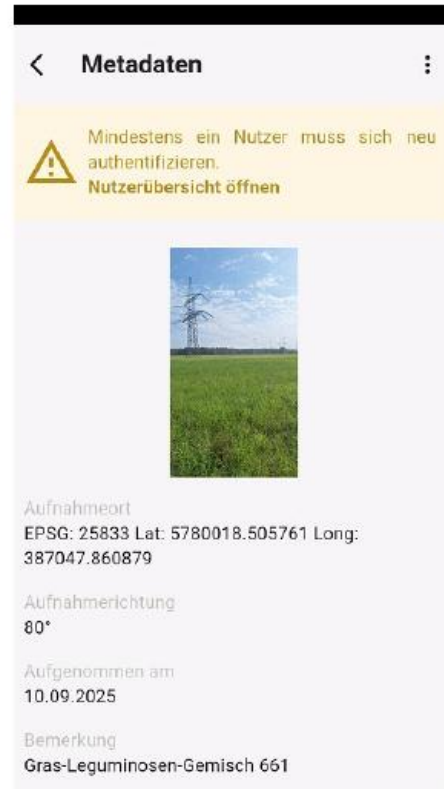
Foto mit der Profil App (Screenshot des Fotos und der Metadaten möglich)

Prüfung möglich (Standort und Datum verfügbar)