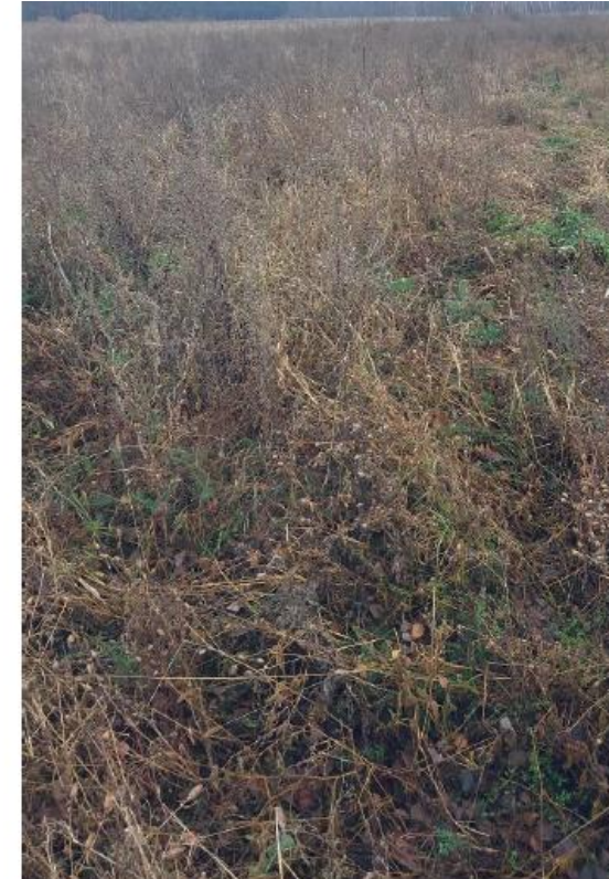
Prüferfoto vom 25.11.2025

Reicht leider nicht aus Keine genauen Angaben zu den Maßnahmen