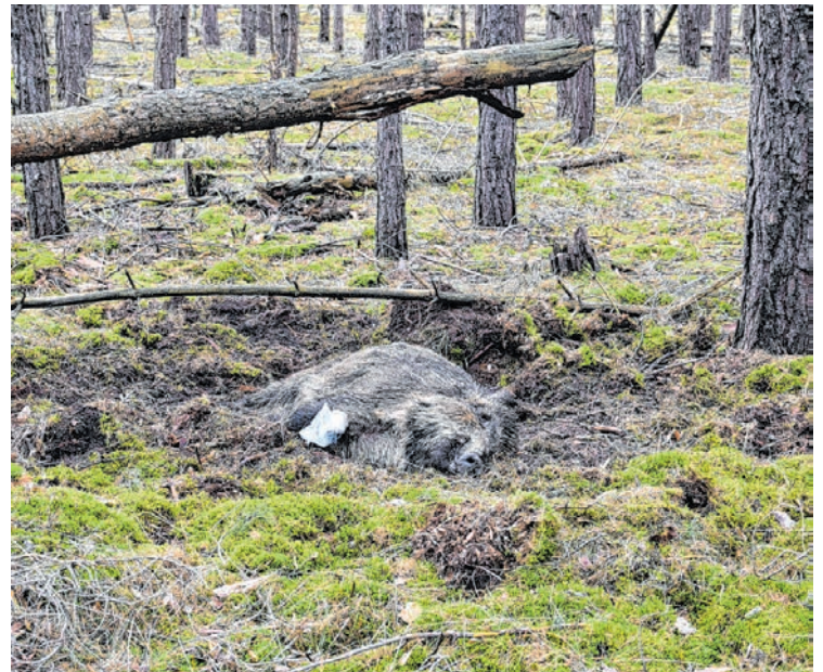
Ein an der Afrikanischen Schweinepest verendetes Wildschwein.