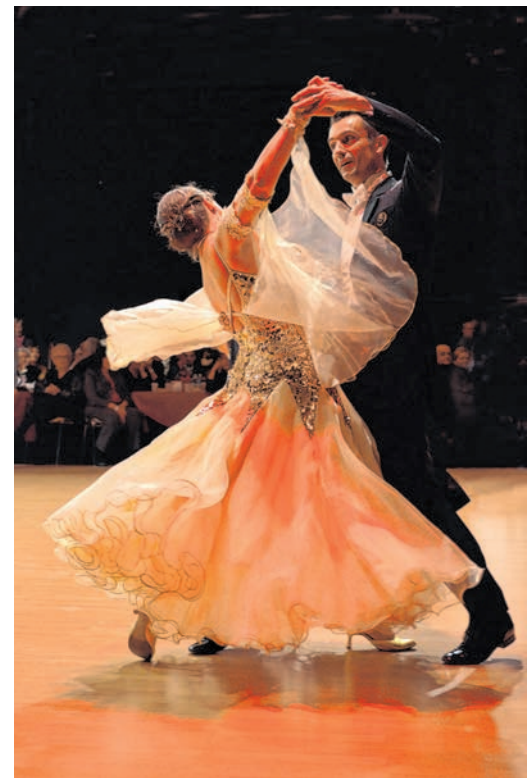
Walzer tanzendes Paar.

Die Musik- und Kunstschule „Johann Theodor Römheld“ des Landkreises Spree-Neiße/Wokrejs Sprjewja-Nysa richtet seit 2007 den „Tag des Tanzes“ in Forst (Lausitz)/Baršć (Łużyca) aus. Dabei konnten zahlreiche Mitwirkende in den verschiedensten Genres, vom Kindertanz, über Breakdance bis zum Ballett gegeneinander antreten.