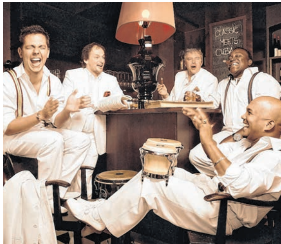
Die Formation »Klazz Brothers & Cuba Percussion« bringt am 13. Mai kubanische Rhythmen nach Guben.

LANDKREIS SPN (pm/caz). Schon am 1. April 2023 geht es „Auf Tour mit dem Landrat“. Die ganztägige Fahrradtour entlang der Spree mit Start und Ziel an der Maustmühle führt zunächst in die historische Stadt Peitz/Picnjo. Weitere Stationen werden Turnow/Turnow und der Teufelsberg in der Disenser Spreeaue sein. Am späten Nachmittag klingt der Tag mit einem geselligen Grillbüffet an der Maustmühle aus. Einwohnerinnen und Einwohner haben die Möglichkeit, bei der gemütlichen Fahrt durch die Ämter Peitz/Picnjo und Burg (Spreewald)/Bórkowy (Błota) mit Landrat Harald Altekrüger ins Gespräch zu kommen. Tickets sind derzeit noch verfügbar und sind für einen Unkostenbeitrag von 5,- Euro p. P. erhältlich. Anmeldungen werden in