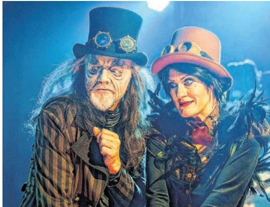
Die Rock-Version von Goethes-Faust bedient sich diesmal auch beim Steampunk.