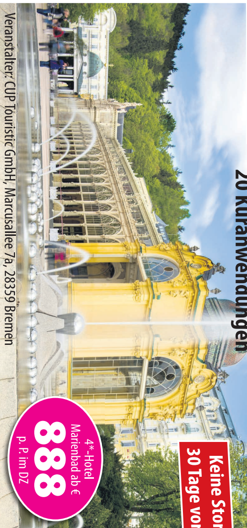
Veranstalter: CUP Touristic GmbH, Marcusallee 7a, 28359 Bremen

Keine Stornokosten bis 30 Tage vor Reisebeginn!